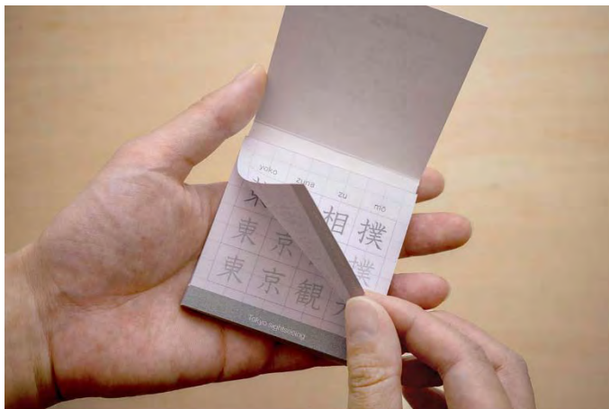
各ページには東京にまつわる四字熟語