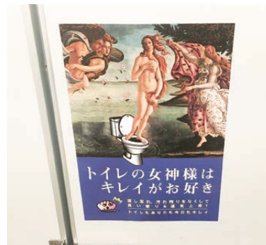
トイレの女神様の貼り紙

もちろん、これだけのことを2人で全て行ったわけではありませぬ。大掃除は全社に呼び