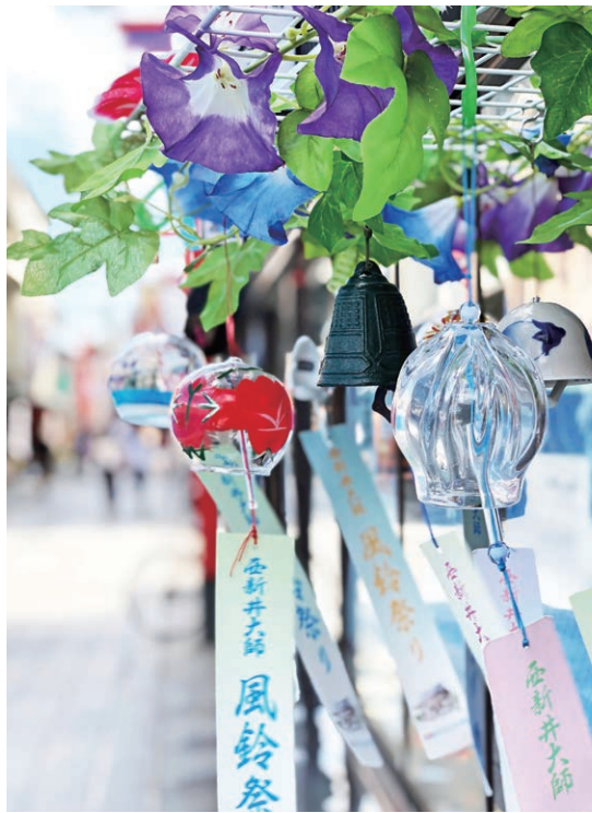
第1回 グランプリ作品 長谷川さん撮影の「風鈴」