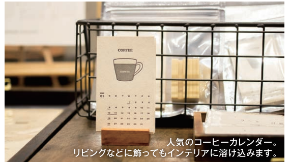
人気のコーヒーカレンダー。 リビングなどに飾ってもインテリアに溶け込みます。