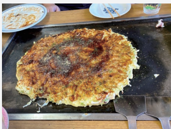
大牟田のお好み焼き

レンジでチン♪ お手軽おしるこは温めると小豆の甘い香りが広がります。もちもちの焼餅とまろやかな小豆の甘さがベストマッチ。鏡開きのときにもおすすめです。ほかほか温まる食べ応え抜群なおしるこのご購入は全国のセブイレブンで。価格：300円（税込）