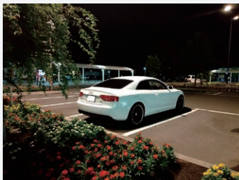
車検上がりの愛車